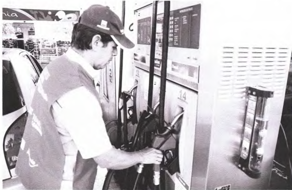
Motoristas estão optando pelo etanol por causa do preço alto da gasolina

Procura pelo combustível derivado da cana-de-açúcar disparou em Apucarana por conta da gasolina acima de R$ 4 o litro; em um posto da cidade, consumo passou de 5 mil para 12 mil litros nos últimos dois meses